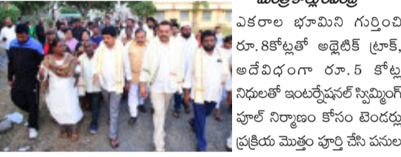
మంత్రి కొల్లూరి రేణుక రెడ్డి ఎకరాల భూమిని గుర్తించి రూ. 8కోట్లతో అడ్వెంటీస్ ట్రాక్, అదే విధంగా రూ. 5 కోట్ల నిధులతో ఇంటియోజ్మెంట్ స్కెమ్ లో ఫైల్ నిర్మాణం కోసం బెండర్లు ప్రక్రియ మొత్తం పూర్తి చేసి పనులను ప్రారంభించామని, అయితే తర్వాత వచ్చిన ప్రభుత్వం దానిని పట్టించుకోకుండా నిర్లక్ష్యం చేసిందన్నారు. ప్రస్తుతం అదే స్థలంలో తిరిగి స్టేడియం నిర్మాణానికి అవసరమైన చర్యలు చేపట్టామని, జిల్లా కలెక్టర్ నుంచి అందుకు సంబంధించిన తీర్మానం పైతే పొందినట్లు మంత్రి తెలిపారు. దాని ఆధారంగా డిపీఆర్ సిద్ధం చేసి దాదాపు రూ. 18 కోట్ల నిధుల వ్యయంతో స్టేడియం నిర్మాణంలోపాటు క్రీడాకారుల వసతి గృహాలను నిర్మించేందుకు రూపకల్పన చేస్తున్నామన్నారు. అదేవిధంగా ఆంధ్రప్రదేశ్ క్రీడల్ అసోసియేషన్ ఆధ్వర్యంలో బెండర్ల స్థలంలో క్రీడల్ స్టేడియం నిర్మాణానికి ఏపీ క్రీడల్ అసోసియేషన్ ఆధ్వర్యం కేటెనీ చిన్నిని కోరడం జరిగిందని, అందుకు ఆయన సానుకూలంగా స్పందించారన్నారు. ఈ సేవార్థంలో అందుకు సంబంధించిన స్థలాన్ని సైతం గుర్తించామని త్వరలో పనులను ప్రారంభించనున్నట్లు మంత్రి తెలిపారు. అదేవిధంగా ఇండోర్ స్టేడియం, స్కైలైన్ కోర్టుల నిర్మించేందుకు ప్రణాళికలు చేస్తున్నట్లు మంత్రి తెలిపారు. ఈ కార్యక్రమంలో మాజీ మున్సిపల్ చైర్మన్ మోటమర్రె బాబా ప్రసాద్, డ్రీన్ స్పోర్ట్ సిఎంఐ అప్పికట్ల అప్పారావు, జిల్లా క్రీడా ప్రాధికారి సంధ్య ఆధికారిణి రూపా్ లక్ష్మి, కూలమి నాయకులు, విద్యార్థులు తదితరులు పాల్గొన్నారు.

అమరావతి, నేటి పత్రిక ప్రజావార్త : క్రీడలను ప్రోత్సహించేందుకు తెనాలిలో సువిశాలమైన స్టేడియంను నిర్మించనున్నామని ఏపీ అహోర, పౌరసంఘాల శాఖ మంత్రి నాదెండ్ల మహేశ్వర్ వెల్లడించారు. 1.76 ఎకరాల మున్సిపల్ భూమిని సేకరించి రూ. 3 కోట్ల అంచనాతో ఇండియన్ స్పోర్ట్స్ కౌన్సిల్ నిర్మాణం చేపడతామని వెల్లడించారు. అందులోనే వాలీబాల్, బాస్కెట్ బాల్ కోర్టులతో పాటు స్టేడియం ఫైల్ కూడా ఏర్పాటు చేస్తున్నామని చెప్పారు. పట్టణ అభివృద్ధి కోసం మంచి ప్రణాళిక సిద్ధం చేయటాన్ని తొలిసారిగా తెలిపారు. ప్రధాన రహదారుల విస్తరణ, మెరుగైన వైద్య సదుపాయాలు, రక్షిత మంచినీటి విధులకు ద్వారా సేవ సరఫరా, తెనాలి కళాకారుల సంస్థలు తదితర అంశాలను ప్రోత్సహించగా తీసుకునే తెనాలి పట్టణాన్ని అభివృద్ధి నిర్మాణంలో నడిపిస్తామని నాదెండ్ల వివరించారు. తెనాలి పట్టణ పరిధిలో రోడ్డు విస్తరణతో పాటు నిర్మాణ కేంద్రాలు ఏర్పాటుపై పరిశీలిస్తున్నామని తెలిపారు. గ్రామీణ ప్రాంత రోడ్డు అభివృద్ధి రూ. 25 కోట్లు మంజూరు చేశారన్నారు. ఇందులో భాగంగా తెనాలి-కల్పవర సీపీ రోడ్డు అభివృద్ధి చేయబోతున్నామన్నారు. రూ 20 లక్షలతో చినారాపూరు పార్క్ ను మరమ్మత్తులు చేస్తూ డిసెంబర్ 30 నాటికి సుందరీకరణ చేయబోతున్నామని, రూ 1.15 కోట్లతో సెనాలి బతానగర్ లో ఒకర్న పార్క్ నిర్మాణం చేపడతామని పేర్కొన్నారు. తెనాలిలో మండగలోపు దుగ్గలూ, మంగళగిరి రోడ్డు మరమ్మత్తులు పూర్తి చేస్తామని చెప్పారు.